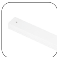
Отверстия под дюбель