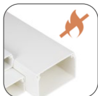
Не поддерживает горение

Кабельные каналы – это современные решения для организации открытой проводки в административных и жилых помещениях. Система кабельных каналов EKF состоит непосредственно из коробов и аксессуаров для соединения, ответвления и поворотов кабельных трасс. Для производства кабель-каналов используется высококачественный композит на основе самозатухающего ПВХ.