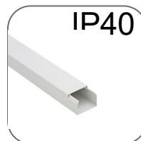
Степень защиты IP40